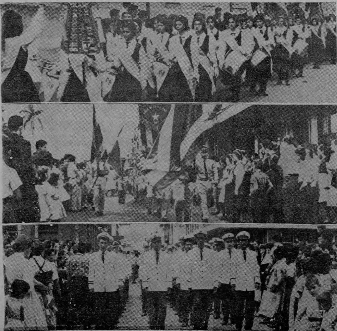
Más de mil estudiantes de segunda enseñanza desfilaron hoy, en homenaje al Día del Papa. Participaron colegios privados, y también grupos de establecimientos oficiales. En la composición, en el orden en que se encuentra, podemos observar: 1) Colegio María Auxiliadora; 2) Liceo de Costa Rica; 3) Colegio Los Angeles, mientras desfilaron por las principales calles.