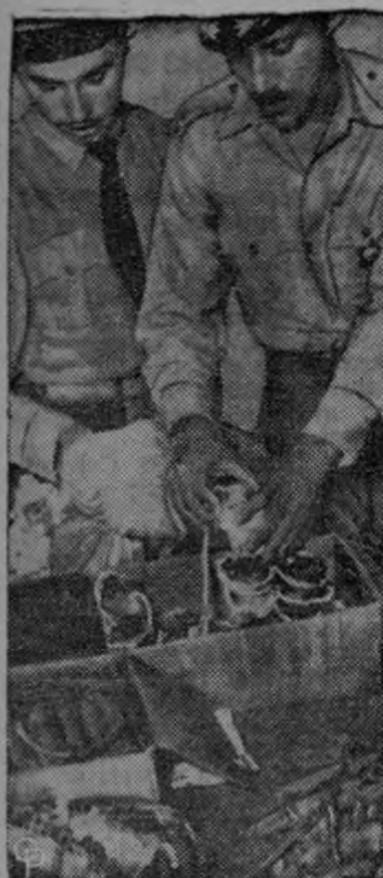
CONFISCAN EXPLOSIVOS. — El jefe de la policía nacional de Cuba Efigenio Almejeras (de- recha), y un aduante exami- nan granadas de tipo casero ha- ladas en un hotel de La Haba- na, que pertenecían a un ex po- licía batistiano Alberto Palacios. En otra ocupación de armas, la policía halló más de 100 rifles y carabinas.