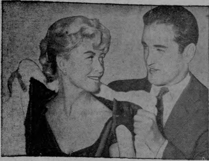
CASAMIENTO EN PERSPECTIVA. —La actriz americana Dorothy Malone y el escritor francés Jacques Bergerac solicitaron una licencia de matrimonio en Hong Kong para casarse cuanto antes. Bergerac es el ex-esposo de la artista Ginger Rogers. La pareja aparece en una fiesta celebrada en Nueva York el mes pasado